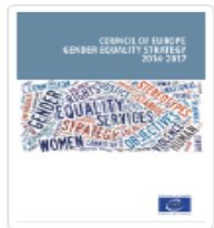
Council of Europe Gender Equality Strategy 2014-2017 COE (Council of Europe, 2015)

CEİM E-Kütüphane koleksiyon veya alt bölümlerinden birini seçtiğinizde yine o bölümün en güncel yayınları "Güncel Gönderiler" başlığı altında listelenir. Dilerseniz o koleksiyon içinde arama yapabilir; dokümanları tarihine, yazarına, konusuna göre de listeleme seçeneklerini kullanarak birçok doküman keşfedebilirsiniz.